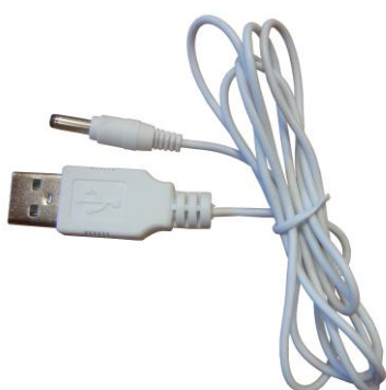
Cable de alimentación

Nota: Los botones de adelante y atrás de su Boxbeat no funcionarán cuando tenga un dispositivo externo conectado. Sólo podrá pasar las pistas hacia adelante y hacia atrás a través de los botones del dispositivo externo.